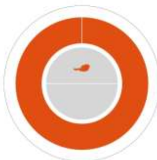
Herkunft der Nachweise

73,79 % Wasserkraft 14,00 % Sonnenenergie 10,22 % Windenergie 1,99 % Sonstige erneuerbare Energieträger